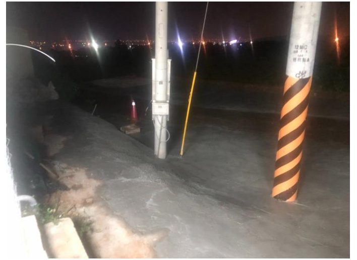
道路拓寬工程-灌漿