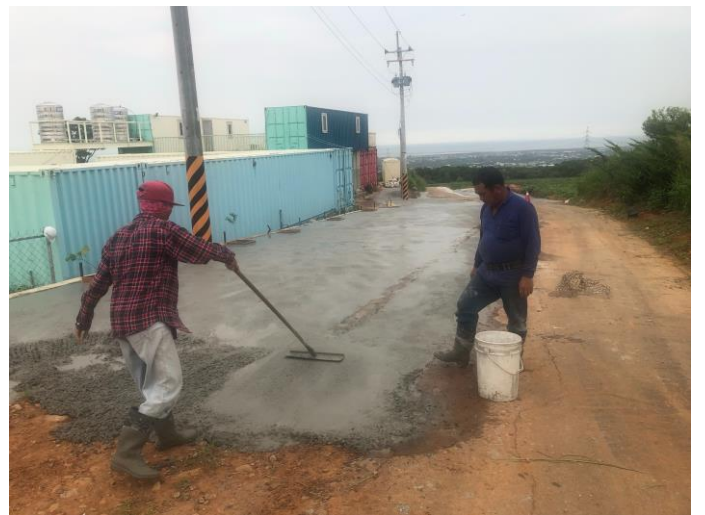
道路拓寬工程-灌漿