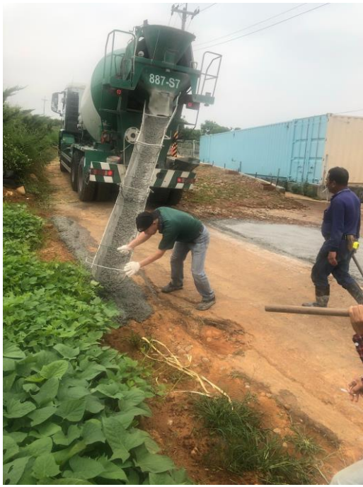
道路拓寬工程-灌漿