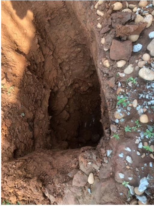
道路拓寬工程-灌漿