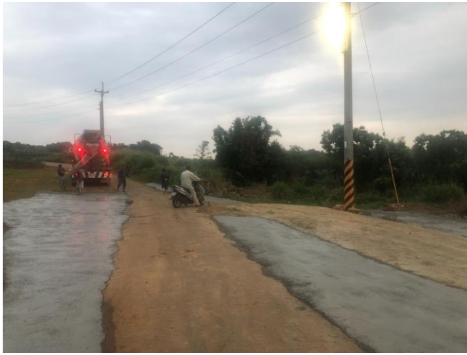
道路拓寬工程-灌漿