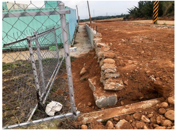
道路拓寬工程-灌漿